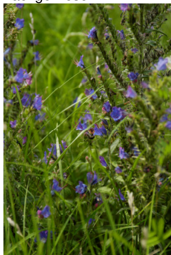
Echium (Natternkopf)

Honig: Von den kritischen Pflanzengattungen sind Echium (Natternkopf) und Borago (Borretsch) aus der Familie der Boraginaceae sowie Eupatorium (Wasserdost) aus der Familie der Asteraceae Bienenährpflanzen, die intensiv von Bienen befliegen werden. Obwohl Senecio -Arten (u.a. Jakobs-Kreuzkraut ) nicht zu den klassischen und eher unattraktiven Bienenweidepflanzen gehören, wurden PA aus Senecio -Arten bereits in Honig nachgewiesen.